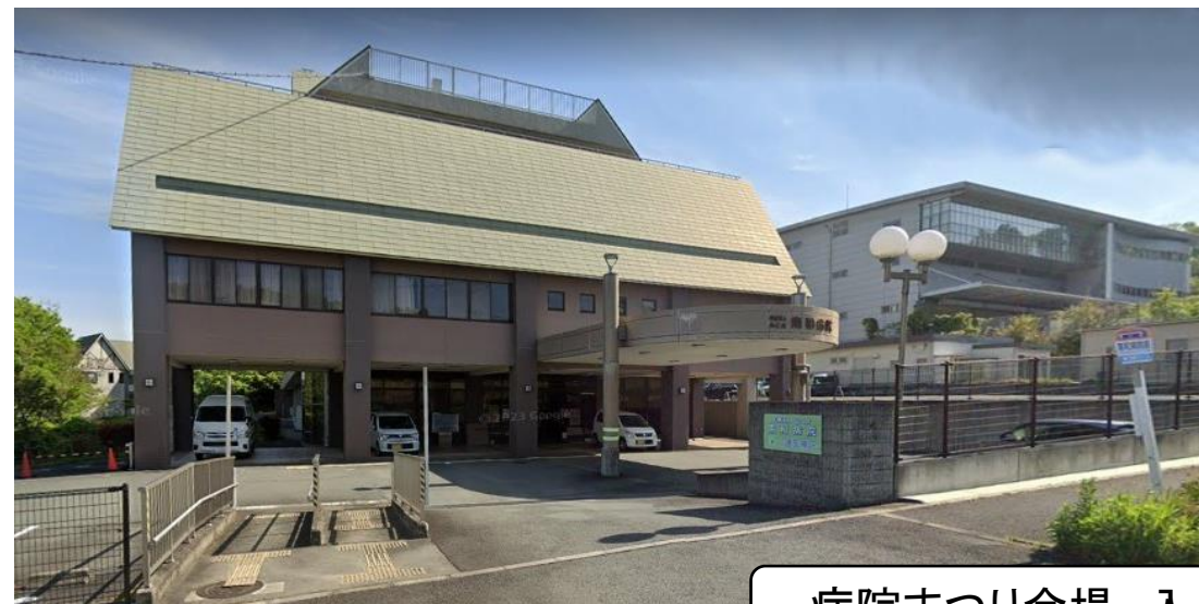
病院まつり会場 入口