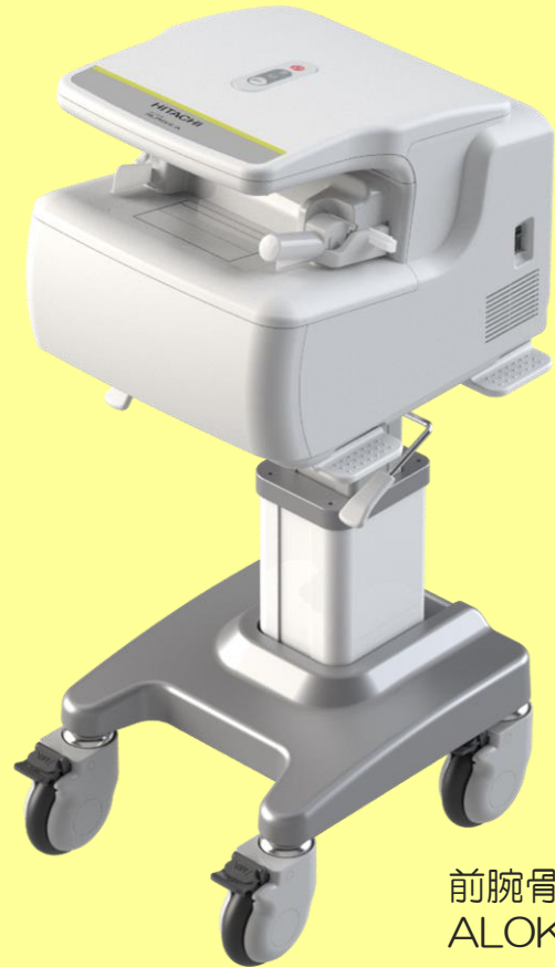
前腕骨密度測定装置 ALOKA ALPHYS A