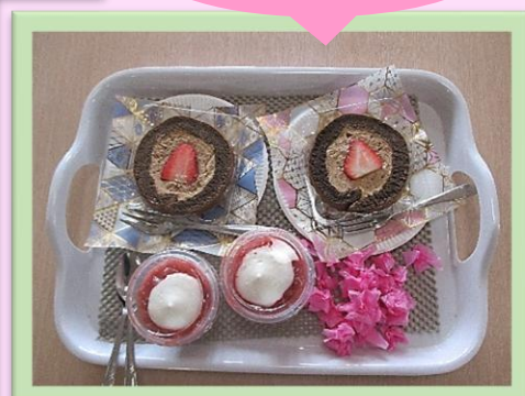
介護医療院スタッフ一同