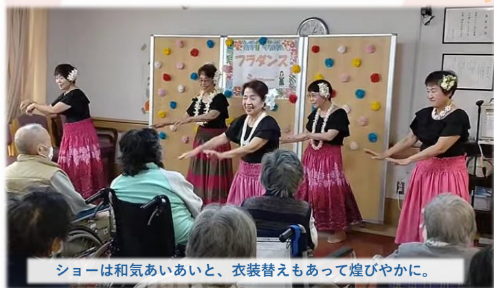
ショーは和気あいあいと、衣装替えもあって煌びやかに。