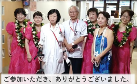
ご参加いただき、ありがとうございました。